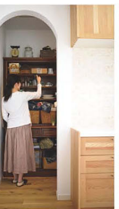
奥さまが絶対に欲しかったというパントリー。食材などを置くことでキッチンまわりが片付く

【書斎スペース】 キッチンにつながっている奥さまの書斎スペース。「ちょっとしたことをするのにとっても便利です」