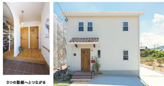
3つの動線へとつながる玄関。シューズクロークでいつも整理整頓