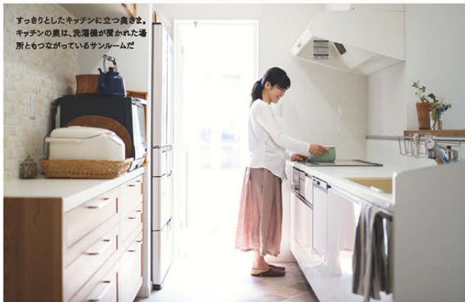
すっきりとしたキッチンに立つ奥さま。キッチンの奥は、洗濯機が置かれた場所ともつながっているサンルームだ