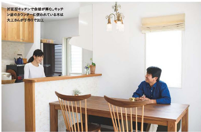
対面型キッチンで会話を楽しむ。キッチン前のカウンターに使われている木は大工さんが手作りで加工

結できるようにしています。サンルームも便利ですね」というご夫妻。日々の生活に便利な間取りとなっている。さらにご両親との同居のことや今後の生活も考え、トイレや玄関などには手すりが設置されている。暮らしやすく、家族にやさしい家だ。