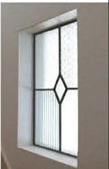
リビングの壁にあるスタンディンググラス、玄関先のニッチなどがNさん宅のアクセントになっている

結できるようにしています。サンルームも便利ですね」というご夫妻。日々の生活に便利な間取りとなっている。さらにご両親との同居のことや今後の生活も考え、トイレや玄関などには手すりが設置されている。暮らしやすく、家族にやさしい家だ。