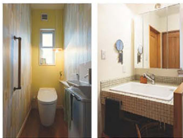
トイレはリビングなどとほがりと変わったデザイン。洗面台は洗い物でもできるように余裕のある大きさに

便利な動線に加えて、リビングのスタンディンググラスやパントリーなどにも個性が感じられるNさん宅。「注文住宅は、窓一つとっても好きなようにつくることが出来ます。本やネットで情報を集めるのも大事ですが、見学会などで実際の家を見るのが一番だと思います。そして「エコハウス」さんは、私たちの話を全部聞いてくださって、希望をカタチにしてくださいました。工事中は現場にもよく行ってましたが、コメントの位置などその場で相談しながら決めていったものもありますよ。現場の方は熱いけどやさしかったので、話しやすくてよかったです(笑)」。 「エコハウス」は、打合せから現場まで、お客様以上の情熱をもって家づくりに取り組んでいる。