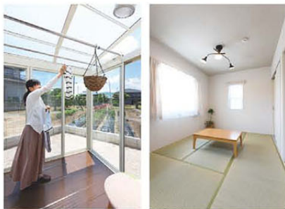
左/晴れた日は洗濯物があつという間に乾くサンルーム 右/白ベースでより広さを感じられるスタイリッシュな和室